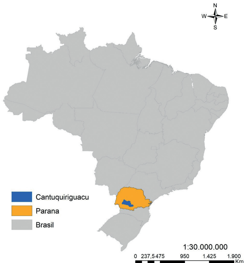
MAPA 1 Localização do Território Cantuquiriguaçu